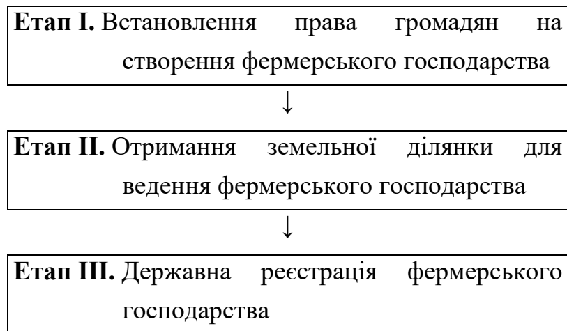
Рис. 2.1. Етапи створення фермерського господарства

Фермерське господарство згідно із [1] може бути створене одним громадянином України або кількома громадянами України, які є родичами або членами сім'ї. Процес створення фермерського господарства можна поділити на декілька етапів, що наведені на рисунку 2.1.